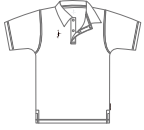
▶本体色: WHITE 刺繍色: BLACK