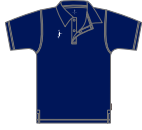
▶本体色: NAVY 刺繍色: WHITE