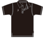
▶本体色: BLACK 刺繍色: WHITE